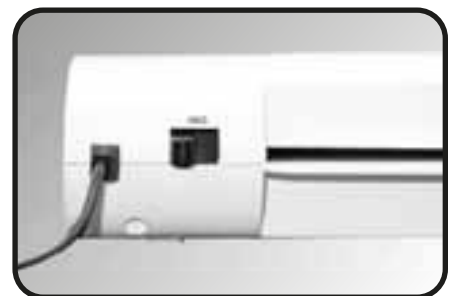
6 ABS Anti-Blocking switch (Black)